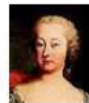
a zakladatelé habsbursko-lotrinské dynastie, císař František I. Štěpán Lotrinský a česká a uherská královna Marie Terezie Habsburská