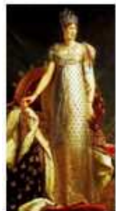
Marie Louisa a její otec - císař a král František II. (I.)