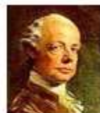
císař a král Leopold II.